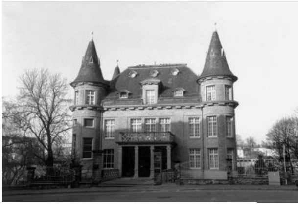
Villa Pauly, Quelle: Steffen Reinhard